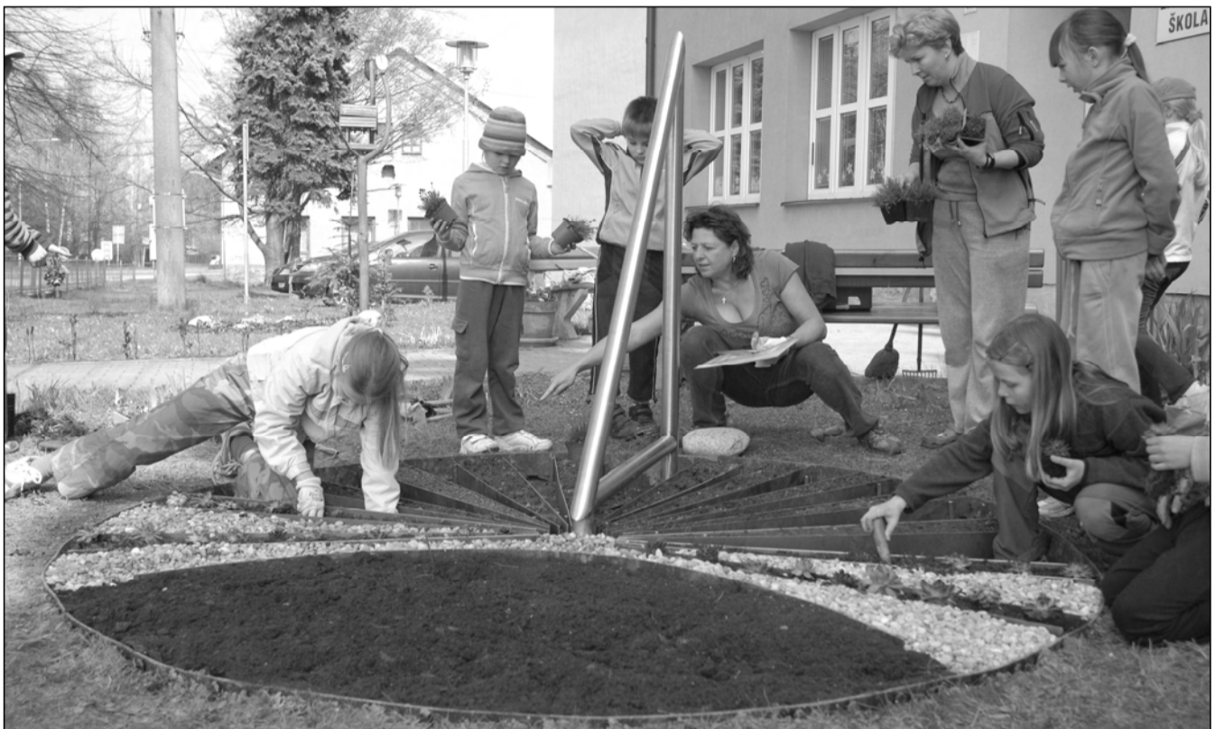
Nové sluneční hodiny před budovou ZŠ Lubina jsou společným dílem tanních žáků, jejich rodičů i učitelů. Realizace se tak dočkal tři roky starý plán na jejich vybudování.