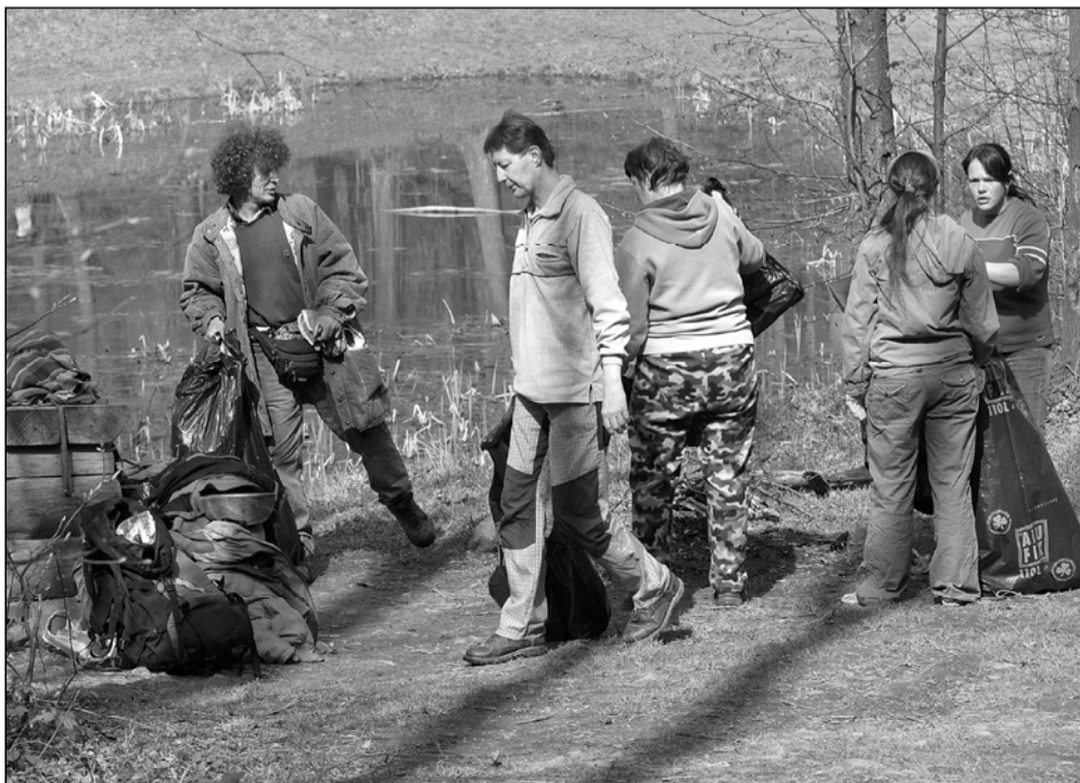
Klienti Denního centra Racek v rámci oslav Dne Země vyrazili uklízet odpadky do lesů nad městem. V úklidu mají v plánu pokračovat i tento týden.