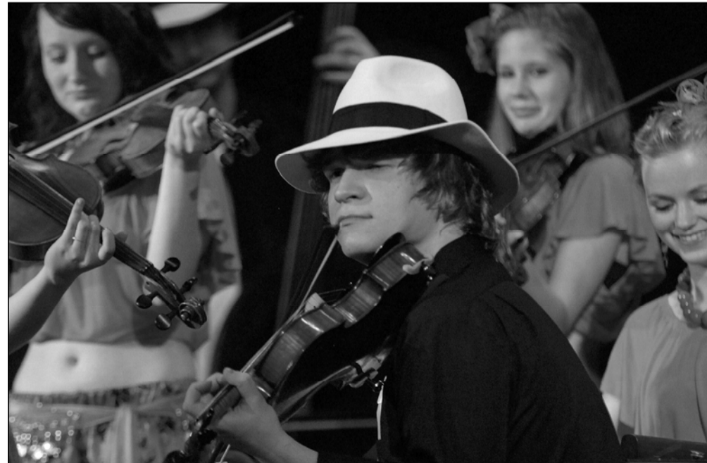
Druhá polovina vystoupení, do které soubor nastoupil v romských kostýmech, se odehrála v poněkud bujarejším duchu a byla i pestřejší, co do volby uváděných skladeb.