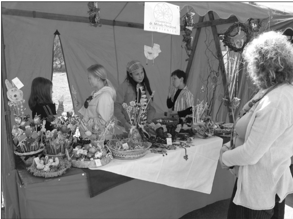
Minulý týden se v centru města uskutečnil Velikonoční jarmark, na kterém prodávali své výrobky žáci ze Základní školy dr. Milady Horákové a Dětského centra.

Vzpomínkové setkání při příležitosti 66. výročí osvobození Kopřivnice a ukončení 2. světové války Čtvrtek 5. května v 17 hodin u pomníku padlých před bývalou ZŠ Náměstí