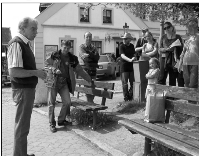
Na závěr pochodu proběhlo na štramberském náměstí losování účastníků o upomínkové předměty a vstupenky do solné jeskyně.

„Cílem projektu je posílit a podpořit význam štramberského období malířova života, vytvořit stálou expozici malířových děl, která je žádána návštěvníky Muzea Zdeňka Buriana. Zvětšení výstavní plochy z dnešních cca 84 m 2 na 137 m 2 včetně zázemí, vytvořit podminiky a prostor pro další aktivity, jako je přednášková činnost nebo