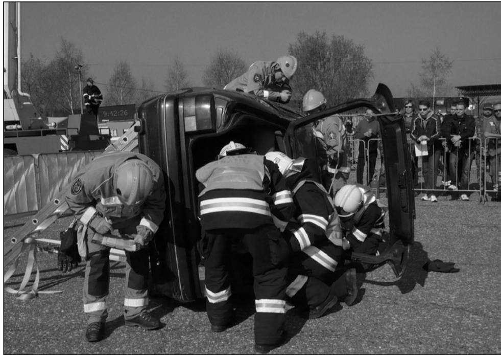
Kopřivnická jednotka sboru dobrovolných hasičů pod dohledem odborných rozhodčích provádí vyproštění osob z automobilu havarovaného na bok.

Multimediální průvodce, který by měl společně s dalšími aktivitami na zlepšení služeb informačního centra v Kopřivnici stát 110 tisíc korun, z nichž 99 tisíc zaplatí kraj, ovšem není jedinou připravovanou aktivitou v oblasti cestovního ruchu. Do podzimu by měl být vydán také nový tištěný průvodce zdejšími regionem, do ostrého provozu budou uvedeny nové webové stránky Lašské brány, stále aktualizovaná je také stránka oblasti na facebooku a připravují se soutěže a další aktivity.