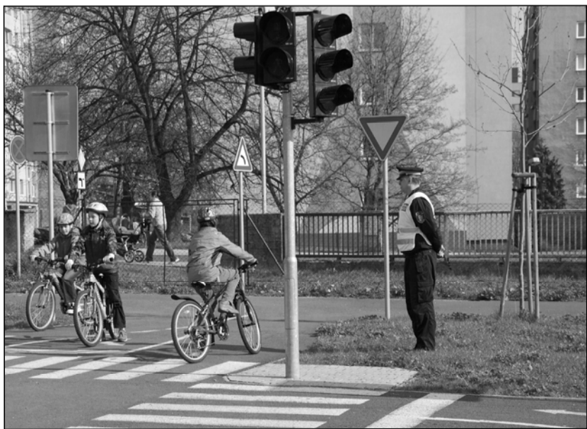
Průkazy cyklisty dostali žáci čtvrtých tříd základních škol, kteří úspěšně složili nejen zkoušky z teorie, ale zvládli i jízdu na kole dle předpisů.