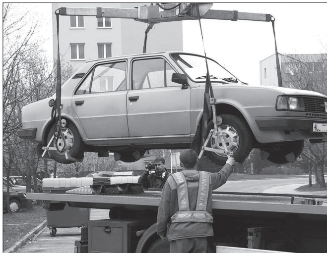
Během letošního čištění komunikací včetně přilehlých parkovišť muselo být odtazeno 125 vozidel, která bránila úklidu.

Jednání valné hromady se tradičně sejde v nekdějším kinosále bývalé ředitelské budovy Tatry (dnes radnice). Registrace akcionářů začíná hodinu před samotným zahájením jednání.