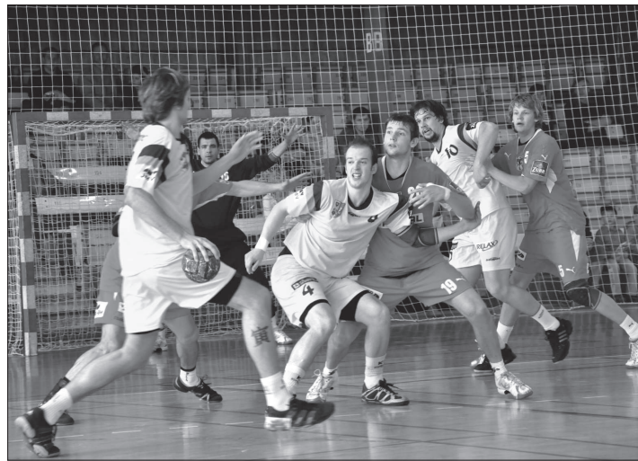
Extraligový tým Kopřivnice je se sezónou 2008/09 relativně spokojený, s Jičínem (zápas na snímku) ale zrovna dobrou bilanci nemá. Třikrát mu podlehl a jen jednou vyhrál.

Podle čerstvých informací z kopřivnického klubu připadá v úvahu kromě varianty jedenácti družstev zredukování na deset či navýšení na dvanáct. Kdyby mužstev bylo pouhých deset, spadly by středněcenné mistrovské zápasy, což by pro amatérské kluby byla podstatná úleva.