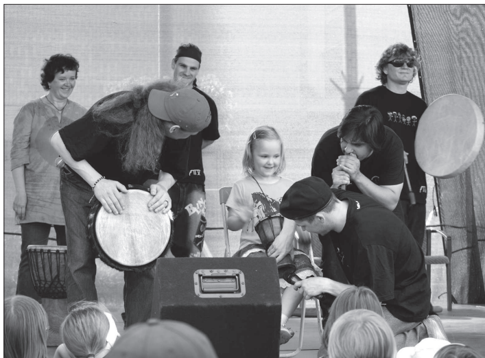
Kapela ALL X si během svého vystoupení v Kopřivnici vyzkoušela také novou členku souboru z publika.

My dohromady na koncertech děláme běžně tak osm čísel, která někdy prokládáme i beatama a jamování. Máme samozřejmě i čísla, která zatím na veřejnosti neděláme. Jsou zatím nedokončená. Musíme ještě trošičku technicky doladit už nahrané hudební pod-