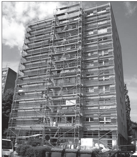
Panelový dům č. p. 1071 na ulici Kpt. Nálepky prý OSBD nechává opravit dráž, než bylo nutné.

Ostatní stavební práce probíhají podle stanoveného harmonogramu a celá stavba má být dokončena do konce srpna.