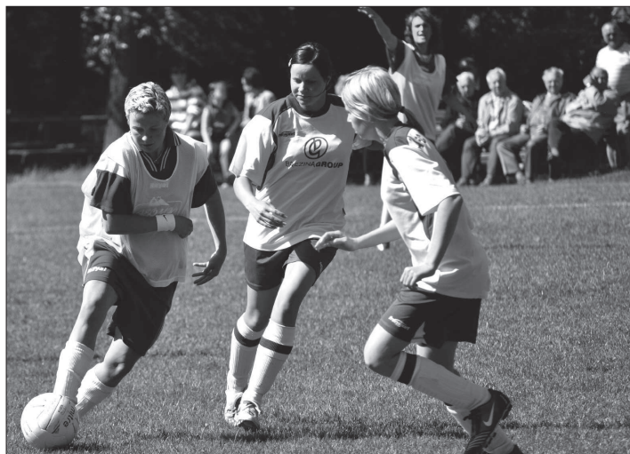
Fotbalisté Lubiny kralovaly domácímu turnaji, který byl uspořádán u příležitosti 15. výročí založení ženského kopané v okrese.

Z výsledků 30. ročníku BIEGU PIĘCIU STAWÓW (Myszków, 14. 6.): 1. P. Magiera (LKS Myszków) 31:25, 2. D. Starzyński (Kolejarz) 32:31, 3. P. Michna (MK Kopřivnice) 32:47, ... 11. R. Purkár 34:55, 24. M. Vrobel 38:29 (7. místo v kategorii do 49 let), 37. J. Kvita 41:03 (7. místo v kategorii do 59 let), 74. P. Navara (všichni MK Kopřivnice) 50:32 (5. v kategorii nad 60 let).