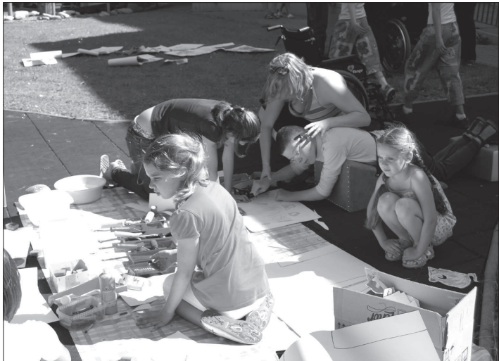
Tentokrát se v dětském centru bořily bariéry mezi klienty zařízení a zdravými dětmi prostřednictvím výtvarných činností.

Kopřivnice (hod) - Kopřivnickému dětskému centru se daří bořit bariéry, které mají děti s handicapem při navazování přátelství a ve styku se zdravými dětmi vůbec. Na zahradě dětského centra se konala akce s názvem Ostrov splněných přání, na níž děti malovaly obrázky, nebo si zkoušely jiné výtvarné techniky. Zdravé děti pomáhaly kreslit dětem s handicapem a ty jim svou radost vracely úsměvem. Pro zdravé děti je to neocenitelná zkušenost, pro handicapované možnost navázat přátelství. „V rámci Her bez hranic jsme už letos pořádali čtyři akce. Tentokrát si s našimi dětmi hrály děti ze Základní umělecké školy Zdeňka Buriana, z tanečních a hudebních oborů,“ uvedla ředitelka dětského centra Dagmar Jančíková.