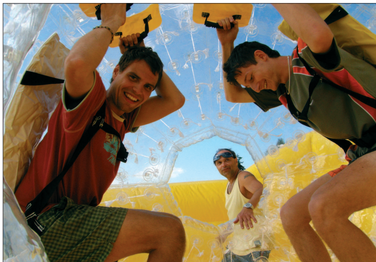
Novou adrenalinovou zábavu připravil pro své návštěvníky provozovatel příbořského koupaliště. Nově mohou zorbovat ze sousedního svahu.

Vyzkoušet zorbing prý může každý zdravý člověk. Pokud ale bude mít chuť okusit chuť adrenalinu právě v Příboře, organizátoři doporučují se předem ohlásit. U tamního koupaliště se za příznivého počasí zorbuje každé nedělní odpoledne a během této doby jsou provozovatelé schopni uspokojit zhruba pět desítek zájemců v závislosti na tom, zda se v koulích koulí lidé po dvojicích nebo jednotlivě. Zájem je podle Korčáka veliký a je pravděpodobné, že jeden den provozu týdně do budoucna nebude stačit a bude se rozšiřovat. Organizátoři také plánují nejrůznější „vychytačky“ jako třeba noční zorbování, kdy se lidé budou pouštět z ostrého umělého osvětlení do absolutní tmy a podobně.