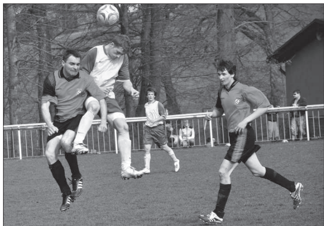
Kopřivníci (ve světlém) se jarní premiéra v Rybí vydařila.

Konečné pořadí KP kadetů: 1. VK Opava 57 b., 2. Kopřivnice 54 b., 3. DHL Ostrava B 47 b., 4. Nový Jičín 45 b., 5. Mosty u Jablunkova 31 b., 6. Frýdek-Místek 28 b.