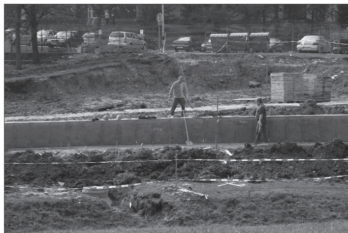
Do konce prázdnin by měly být dokončeny práce na výstavbě dětského dopravního hřiště, které vzniká na ulici I. Šustaly.

Na to, zda budou žádosti úspěšné, se ale zatím čeká, výsledky zatím nejsou známy ani u projektů podaných na podzim minulého roku.