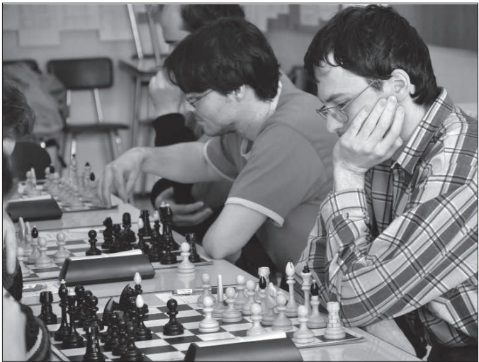
Kopřivnický šachový A tým převládával v posledním kole krajské soutěže Svinov B, a stvrdil tak svou suverenitu v soutěži, z níž postoupil do krajského přeboru.

K o p ř i v n i c e (jfk) - Bez jediné porážky prošel krajskou soutěží šachový tým Kopřivnice A. V posledním kole porazil na domácích šachovnicích Svinov B 7,5:0,5 a stvrdil tak svou převahu v soutěži, kterou nakonec vyhrál s desetibodovým náskokem na druhou Porubu C. Odměnou za letošní suverenitu je Kopřivnici postup do krajského přeboru, na který si sbírala body už tři roky. Kopřivnice B vyhrála ve Fulneku nad jeho A týmem 4,5:3,5 a v soutěži obsadila velice pěknou čtvrtou příčku.