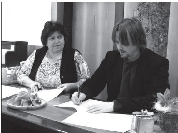
Poslední březnový den došlo ke slavnostnímu podpisu smlouvy o pronájmu Truby mezi Štramberkem a Valašským královstvím.