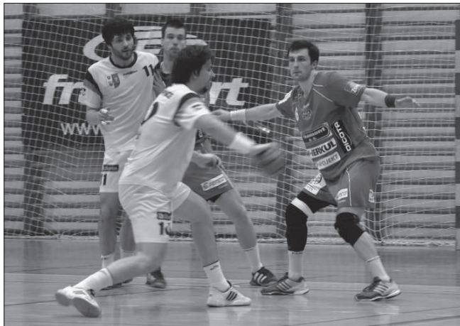
Házenkáři Kopřivnice dali Duklu na domácí palubovce zabrat, pokračování čtvrtfinálové série si ale nevyhnutli. Do semifinále jde Dukla Praha.

Branky Vlčovic: 1. Lichnovský, 3. Beseda. Sestava: Bartoň - Drozd, Velička (87. Gajdiček), R. Jalůvka, J. Jalůvka - Hanzelka, Čevela, Poláček, Klos - Lichnovský, Beseda (74. Reček)