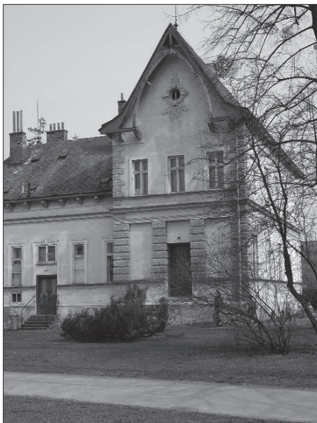
Zvažovaná rekonstrukce loutkového divadla nebude možná bez dotací.

Jako další by se měl rekonstrukce dočkat zimní stadion. Projekt na tuto akci by měl být připraven do podzimu. Je ale třeba rozhodnout, jak široce má být rekonstrukce pojatá. Další na řadě by pak měla být údajně rekonstrukce koupaliště. „Současné betonové vany bazénů by měly být nahrazeny nerezovými, přibudou také vodní atrakce nejen pro děti a zlepší se i zázemí pro návštěvníky,“ prozradil Jalůvka. Jak na sebe budou navazovat jednotlivé etapy ještě bude schvalovat rada města, je pravděpodobné, že po koupališti přijde na řadu letní stadion.