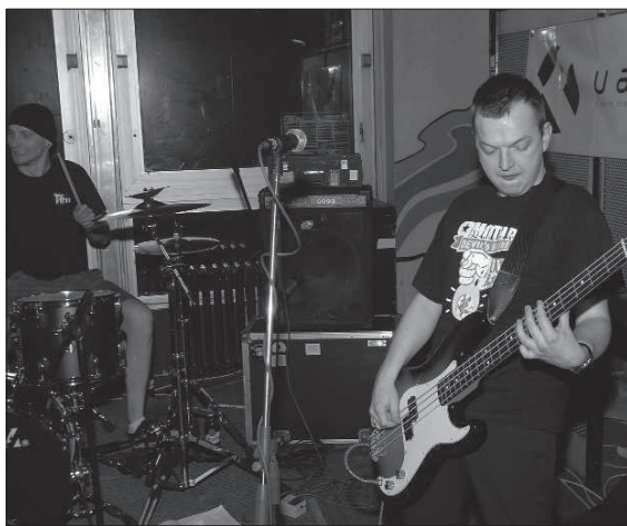
Polská kapela Plum nezůstala při svém koncertu v Kopřivnici nic dlužna své pověsti nois rockové jedničky ve své domovině.

Po nejistě působící první skladbě začali Plum dokazovat, proč jsou doma považováni za nois rockovou jedničku. Výrazné a přesné bicí doplněné zručně zahranou basovou linkou a k tomu syrová kytara. Energii sršíci muzikanti se předvedli jako výborní a navíc skvěle sehraní instrumentalisté a jejich hudba kombinovala pasáže chaotického temného hluku s propracovanými melodickými nápady. Nejlépe ingredience celého jinak povedeného koktejlu byl tak zpěv, který ale zanikal pravděpodobně i dílem již zmíněného 'garážového' ozvučného koncertu. David Macháček