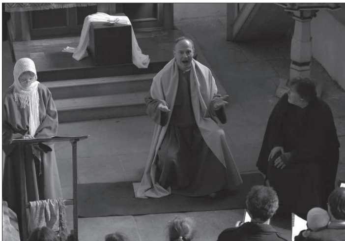
Herci ze štramberského ochotnického souboru Pod Věží v neděli inscenovali chrámovou hru Barabáš v atraktivním prostředí kostela sv. Kateřiny.