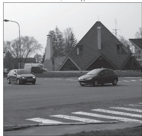
V polovině roku se rozjedou naplno stavební práce a stávající křižovatka se změni v kruhový objezd.

V současné době byly zahájeny stavební práce na obchvatu Příbora a narovnáni komunikace I/58, a to odvozem ornice. Obchvat Příbora začíná napojením na rychlostní komunikaci I/48 a končí před rodinnými domky na začátku Vlčovic, na tzv. Zábřežkách, které jsou na úrovni firmy Brose. „Budování obchvatu by mělo být dokončeno až do konce roku 2011,“ upřesnil časovou náročnost výstavby celé etapy obchvatu místostarosta.