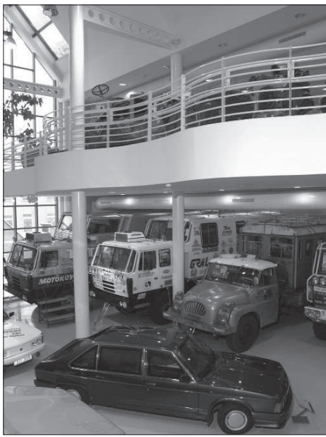
Tatrovské Technické muzeum je největším lákadlem Regionálního muzea Kopřivnice.