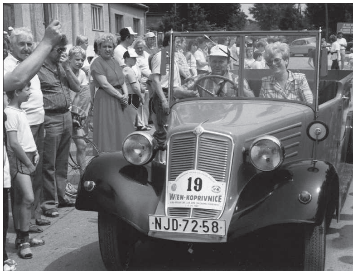
Tatra veterán Rallye Wien - Kopřivnice v roce 1987.

V průběhu let začaly jednotlivé kluby, převážně prostřednictvím podnikového muzea, navazovat první kontakty s Tatra-