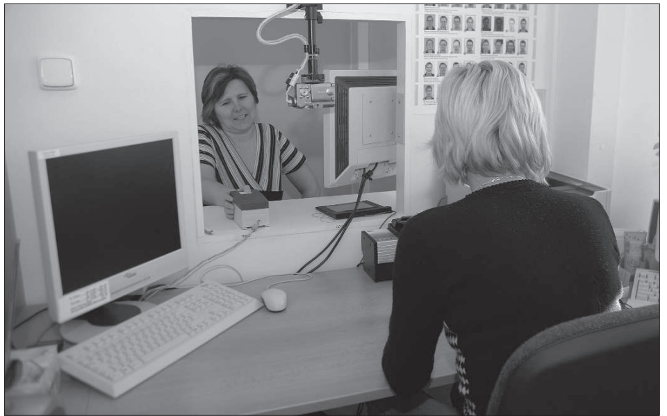
Pracoviště odboru správního, na kterém úřednice snímají biometrické údaje žadatelů o pas. Procedura je mnohdy komplikovaná a zdržuje vyřízení nových cestovních dokladů.