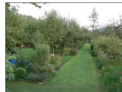
6 - Zahrádkářská osada