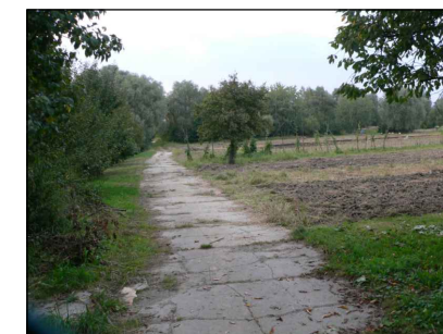
7 - Zastavitelné území