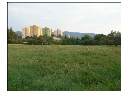
3 - Zastavitelné území