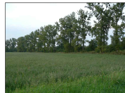
4 - Zastavitelné území