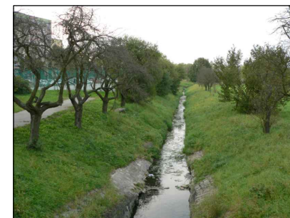
2 - Tok Kopřivničky