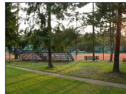
1 - Tenisový areál