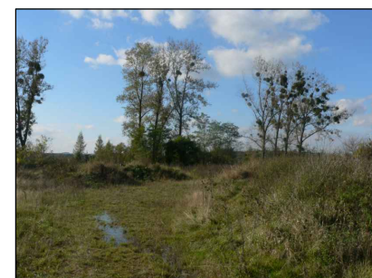
8 - Bývalá skládka