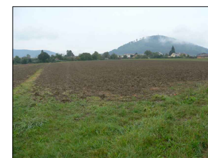
4 - Zastavitelné území