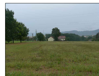
3 - Zastavitelné území