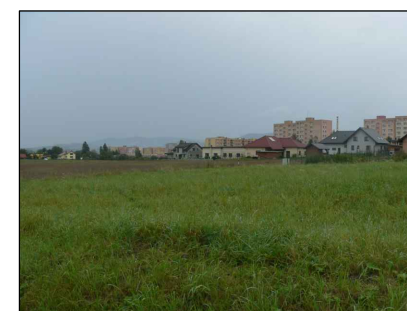
2 - Zastavitelné území