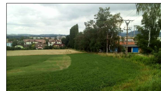
1 - Pod zahrádkama