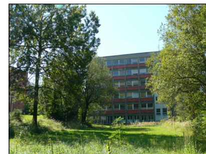
9 - Domov mládeže