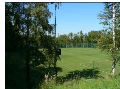
10 - Fotbalové hřiště