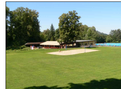
1 - Areál koupaliště