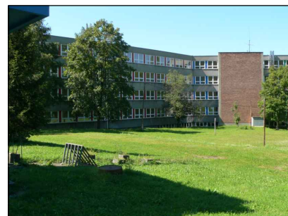
8 - Sou