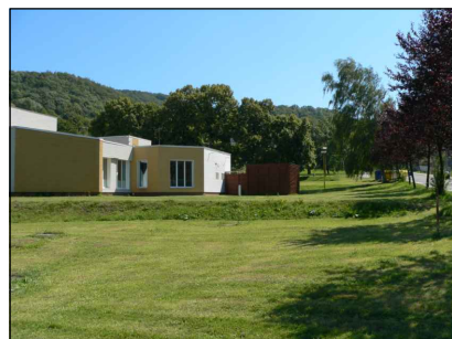
7 - Okolí bazénu