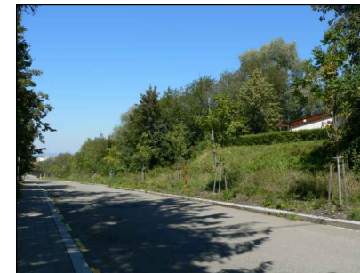
3 - Bowling a bezprostřední okolí