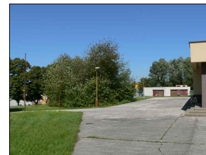
6 - Voš