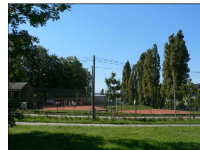
5 - Stadion, volejbal, tenis