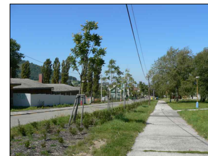
ST1 - podél sportoviště ul. Husova