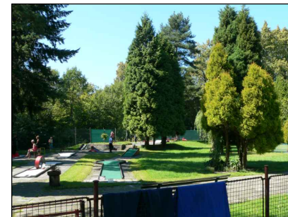
2 - Minigolf