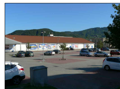
5 - Parkoviště u OC