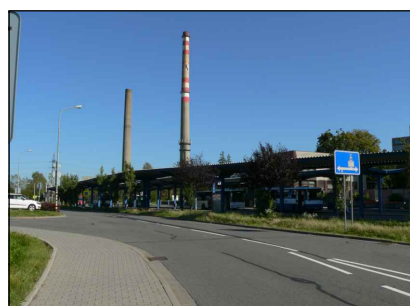
2 - Autobusové nádraží