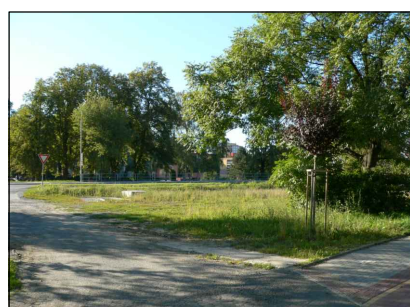
8 - Zbytková plocha