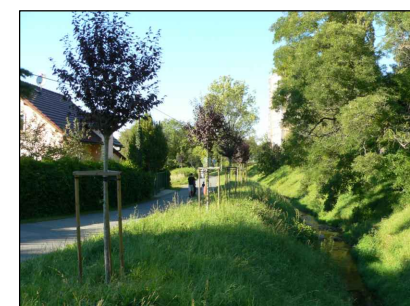
7- Poděl Kopřivničky