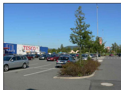
3 - Parkoviště u Tesca