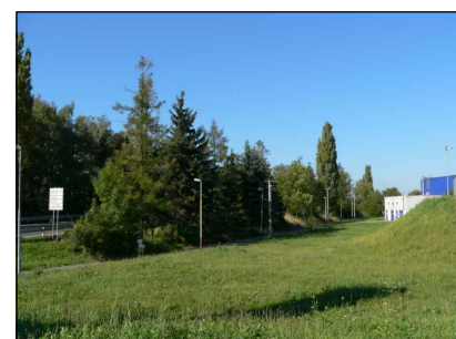
4 - Plocha za Tescem + cykl.stezka