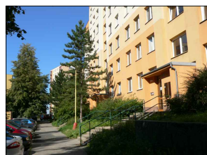
9 - Sídlisté