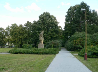
19 - Předprostor ZŠ E. Zátopka