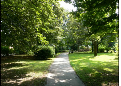
14 - Parčík s fontánou kostka (pás)