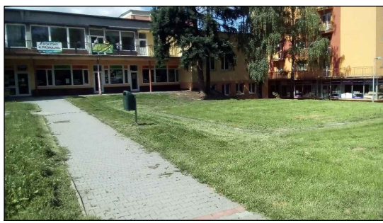
1 - Plocha před domem služeb