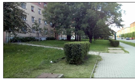
4 - Plocha před obytnými domy