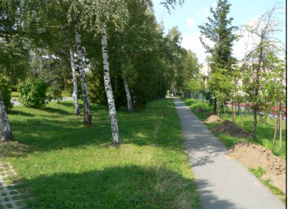
17 - Parking a přílehlý prostor u ZŠ E. Zátopka