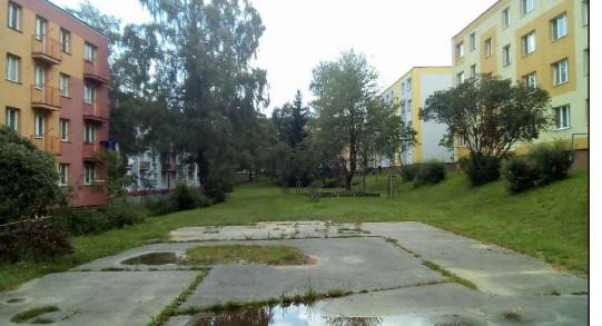
20 - Sídlíště