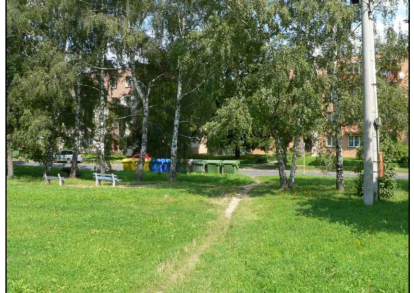
13 - Dětské hřiště