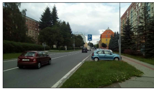
3 - Uliční koridor Obránců Míru