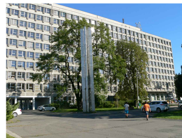
5 - Okolí MÚ