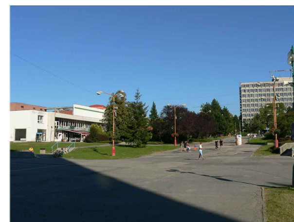
3 - Centrální plocha