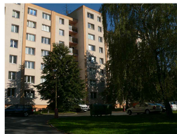
4 - Plocha za panel. domem