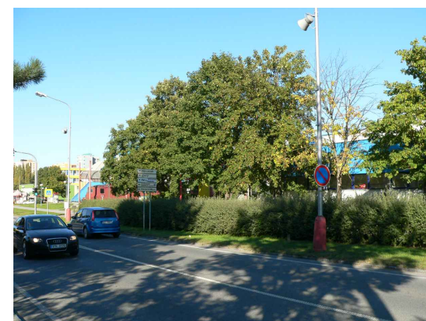
2 - zelený pás podél hl. komunikace