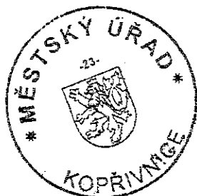
Ing. Milan Černý referent odboru stavebního řádu, územního plánování a památkové péče

Rozhodnutí je vykonatelné nabytím právní moci nebo podle § 91 odst. 4 správního řádu dnem následujícím po dni, ve kterém se poslední z účastníků řízení písemně vzdal svého práva na odvolání.