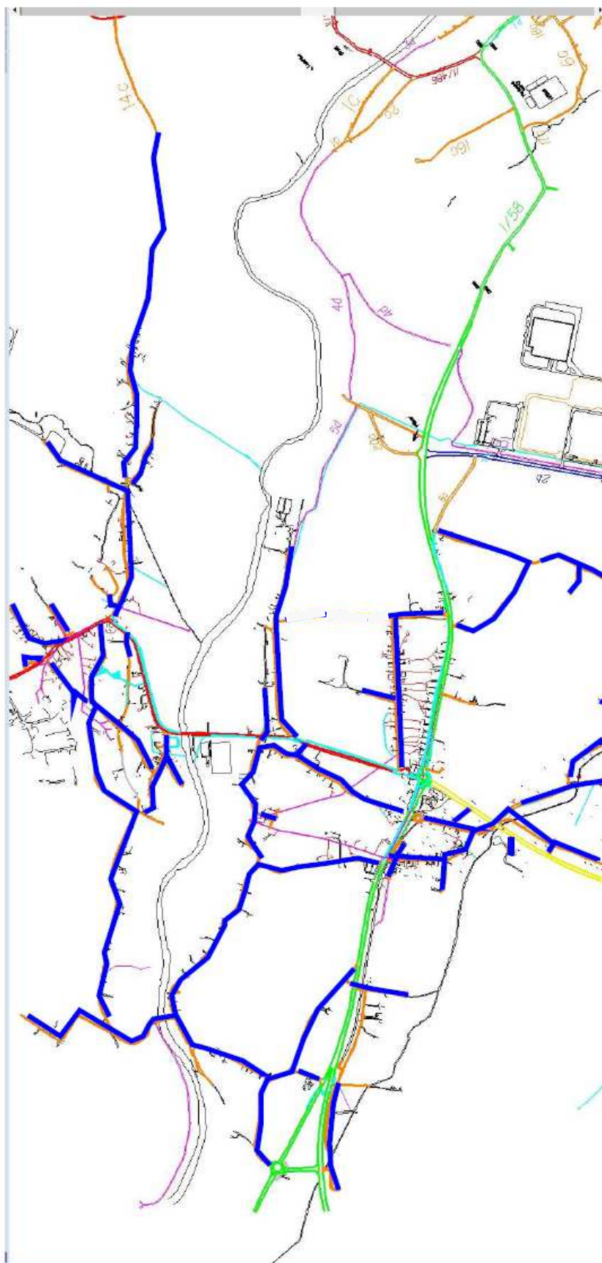
MK v Lubíně